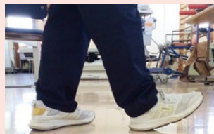
歩く時は踵から床に着地するように意識しましょう。（つま先をあげる）