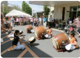
尽誠学園太鼓演奏