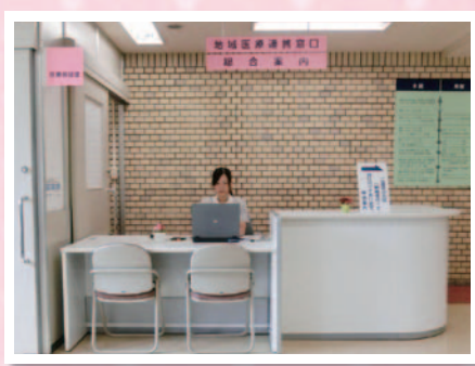
本館入り口を入るとすぐ正面が地域医療連携窓口です。

地域医療連携窓口は、総合案内も兼ねています。毎日笑顔でお待ちしておりますので、困ったことがありましたら、気軽にお声をお掛けください。